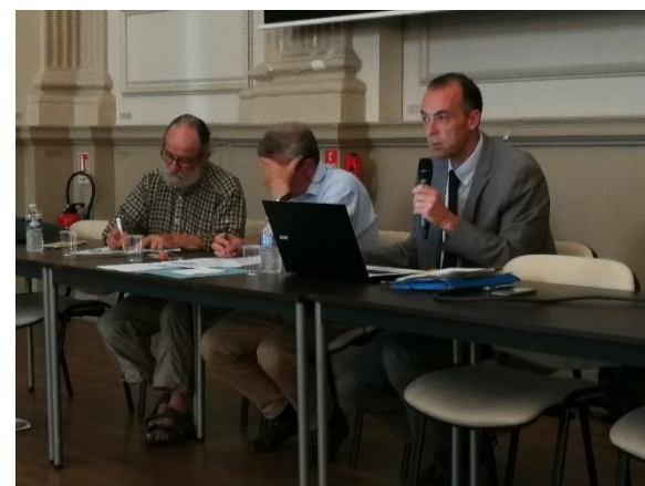
Débat sur le nucléaire