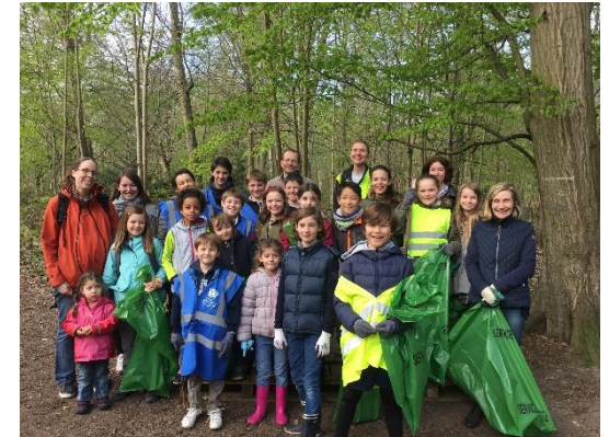
Forêt propre 2019, conseil municipal junior

Plus de 20 réunions de travail des administrateurs, et deux CA formels